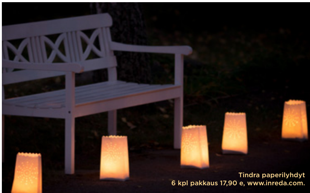
Tindra paperilyhdyt 6 kpl pakkaus 17,90 e, www.inreda.com .

Sydänlyhty 22,90 e, Indiska, isot lyhdyt 69,90 e Kodin Anttila.