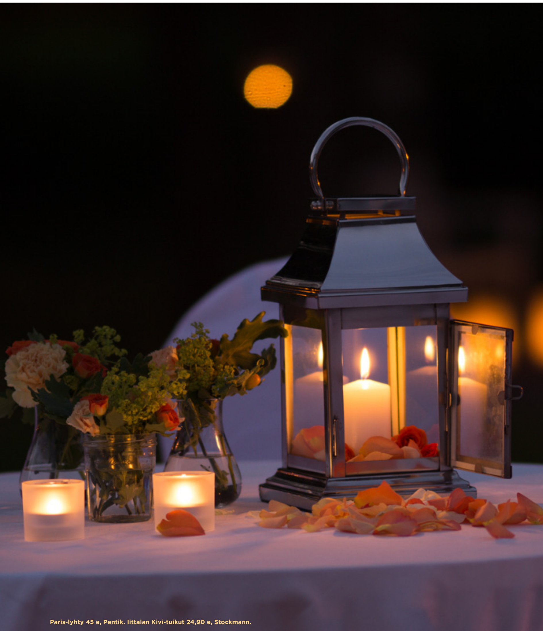
Paris-lyhty 45 e, Pentik. liittalan Kivi-tuikut 24,90 e, Stockmann.