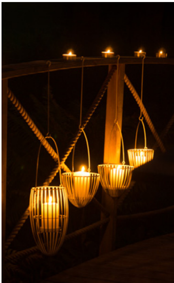
Kaunista kaarisiltaa valaisevat tuikut ja lyhdyt. Papai-lyhdyt 18 e, Pentik ja tuikut 12,10 e/20 kpl, Duni.

Kuvauspaikka Haikon Kartano, www.haikonkartano.fi